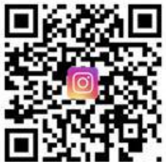
Instagram CTBC Careers